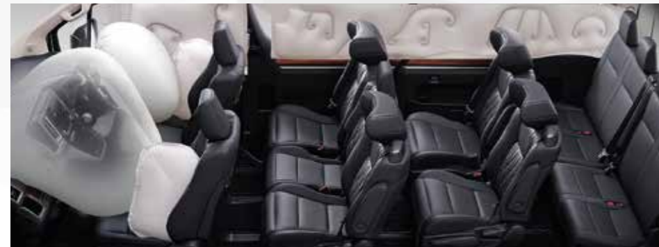
ถุงลมเสริมความปลอดภัย 9 ตำแหน่ง