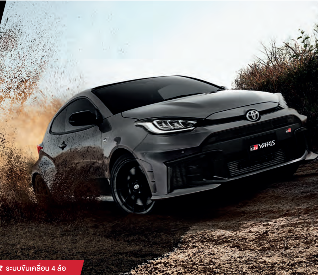
ภาพข้างต้นเป็นเพียงภาพตัวอย่างเท่านั้น รายละเอียดหรืออุปกรณ์บางส่วนในภาพอาจแตกต่างจากที่จำหน่ายจริง ทั้งนี้บริษัทฯ ขอสงวนสิทธิ์ในการพิจารณาเปลี่ยนแปลงรายละเอียดหรืออุปกรณ์มาตรฐานตามที่เห็นสมควร

เพิ่มประสิทธิภาพ และสมรรถนะการขับขี่ ระบบกันสะเทือนหน้า แบบ แม็คเฟอร์ริสันสตรีก และด้านหลัง แบบ คัมเบลวิชโฮน ช่วยให้ทรงตัวมั่นคงแม้เข้าโค้งด้วยความเร็วสูง พร้อม เพ็็นน็อดยึดติดกับโช้คอัพ เพื่อเสถียรภาพในการควบคุม อีกทั้ง เพ็็นจุดเชื่อมตัวถังให้มากขึ้น เพื่อความแข็งแรงสบายขณะขับขี่ ลดการสั่นสะเทือน และ ติดตั้ง Torsen® LSD เพื่อช่วยกระจายแรงบิดของล้อคู่หน้า-หลัง ให้สัมพันธ์กับสถานการณ์การขับขี่ และการควบคุมที่ยืดหยุ่น